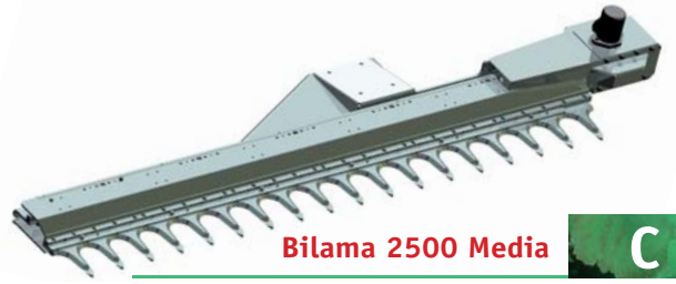
Bilama 2500 Media C

Bilama 2500 mm leggera capacità di taglio 0/40 mm Light 2500 mm (8.2 ft) double blade with 0/40 mm (1.6 in) cutting capacity Sistema de dos hojas 2500 mm liviano capacidad de corte 0/40 mm Double lame 2500 mm légère capacité de coupe 0/40 mm