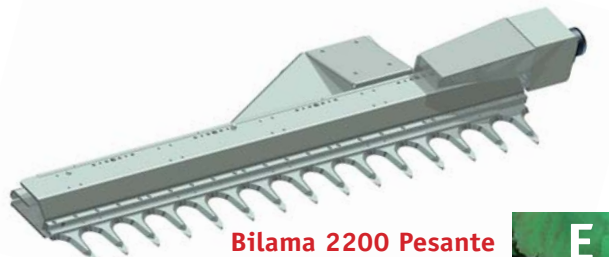
Bilama 2200 Pesante E

Bilama 3000 mm media capacità di taglio 0/60 mm Medium 3000 mm (9.8 ft) double blade with 0/60 mm (2.4 in) cutting capacity Sistema de dos hojas 3000 mm mediano capacidad de corte 0/60 mm Double lame 3000 mm moyenne capacité de coupe 0/60 mm